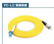
FC 轉 LC