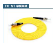
FC 轉 ST