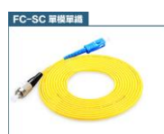
FC 轉 SC