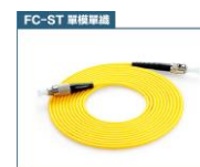
FC 轉 ST