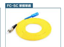
FC 轉 SC