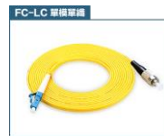
FC 轉 LC